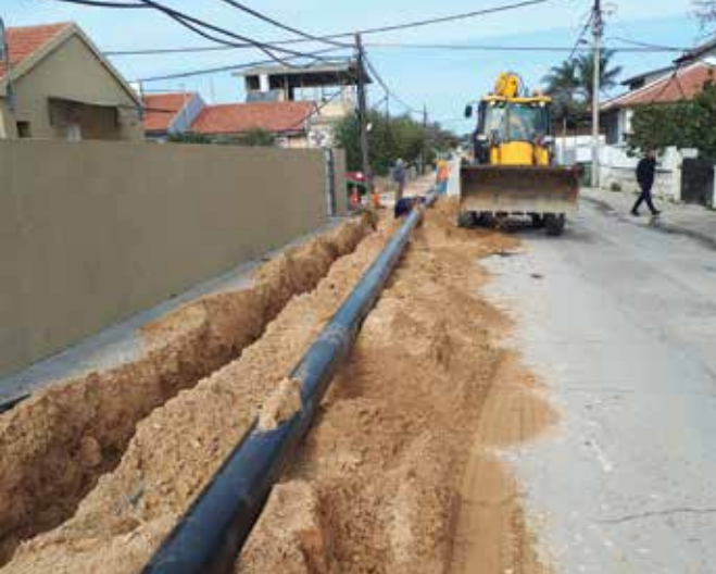
רחוב בר אילן שדרוג קווי המים לקטרים 6" - 8"