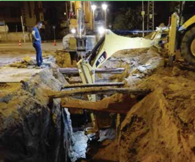
צומת פרנק/שמעוני שדרוג קווי ביוב בקוטר 630 מ"מ