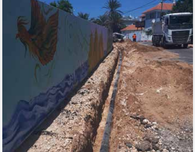
רחוב מבצע עזרא שדרוג קווי מים בקוטר 6"